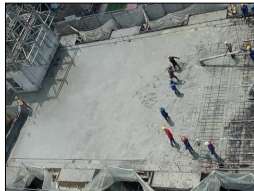
เดือนตุลาคม 2566