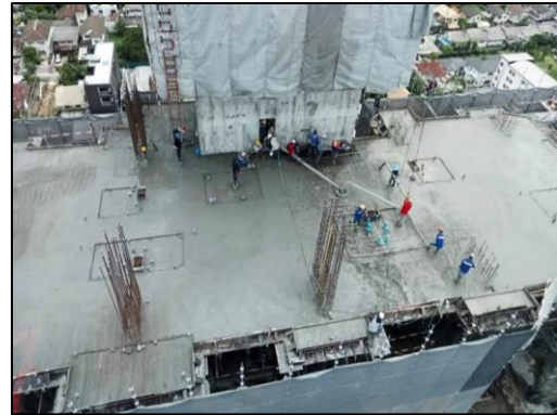
เดือนสิงหาคม 2566