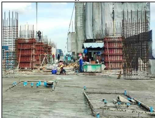
เดือนกันยายน 2566