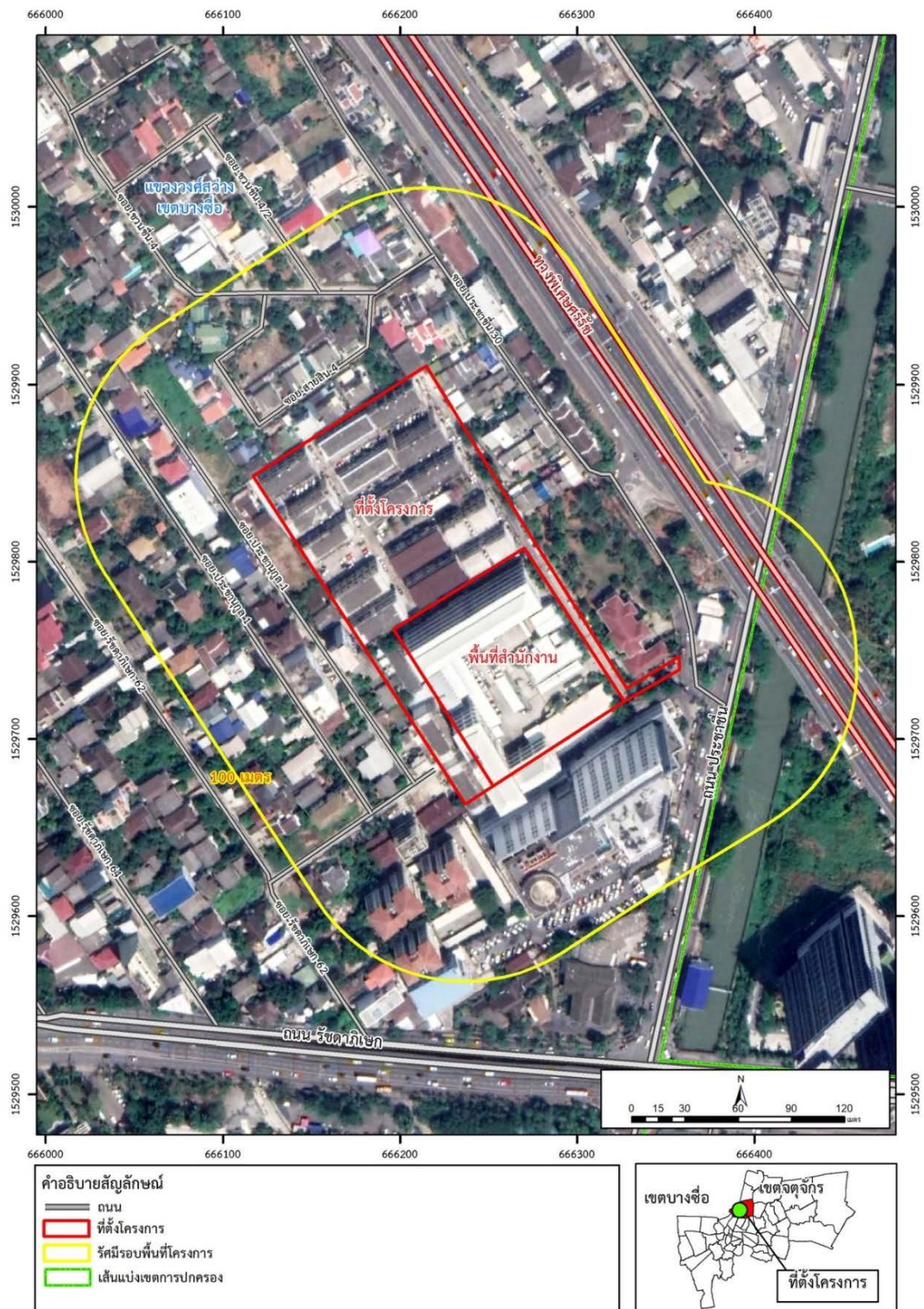
รูปที่ 1.2-1 ที่ตั้งโครงการ